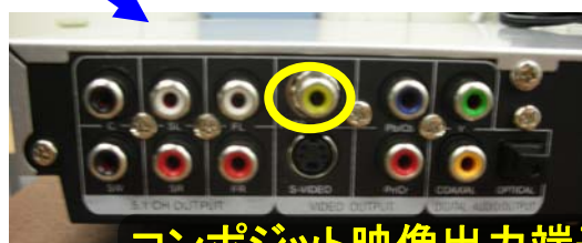
コンポジット映像出力端子 (黄色)

◎TVとDVDプレーヤーの接続で使用するのは、「コンポジット映像出力端子」だけです。通常、音声ケーブルは接続しません。