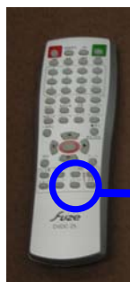
2/5.1CHボタン (一番下の段、右から2番目)

・「2/5.1CH」ボタンを押すたびに、ダウンミックスON/OFFが切り替わります。「DOWNMIX 5.1CH」と「DOWNMIX STEREO」が選択できるので、「DOWNMIX STEREO」へ変更することで音が出るようになります。