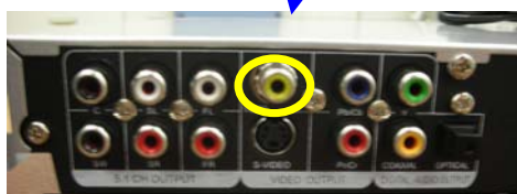
コンポジット映像出力端子 (黄色)