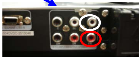
フロントスピーカー接続端子 FL(白)/FR(赤)

・付属のAVケーブルの映像ケーブルを「コンポジット映像出力端子」、音声ケーブルを「フロントスピーカー接続端子(FL/FR)」へ接続してください。